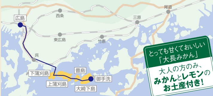
御手洗町並み保存地区

とっても甘くておいしい「大長みかん」 大人の方のみ、みかん&レモンのお土産付き!