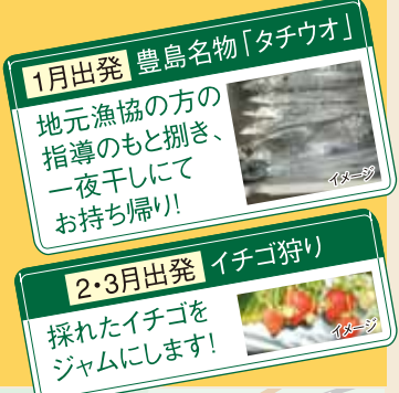
1月出発 豊島名物「タチウオ」

1月に参加の方は、豊島で地元漁協の方の指導のもと「タチウオ捌き体験」をしていただきます。捌いたタチウオは、一夜干しにしてお持ち帰り下さい。2月・3月に参加の方は、「いちご狩りとジャム作り」体験をしていただきます。いちご狩りで採れたいちごでジャムを作ります。恵みの丘で昼食後、クラフト体験です。約1時間でハーブ石鹸が出来上がります。自分で作ったハーブ石鹸をおみやげに、帰路につきます。