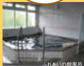
ふれあいの館風呂

■募集人員/26名 ■最少催行人員/15名 ■食事/昼1回 ■添乗員/5名様以上より同行します