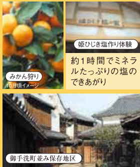
みかん狩り 10月頃イメージ

とびしま海道にかかる橋を渡り、まずは江戸時代からの町並みが残る御手洗町並み保存地区を散策します。まるで江戸時代にタイムスリップしたかのような感覚を味わえるでしょう。温暖な瀬戸内の気候と水はけの良い段々畑で栽培される甘くておいしい大長みかん狩りもお楽しみ下さい。コクのある甘味が全国でも人気です。漁師料理かつら亭で昼食の後は、恵みの丘でクラフト体験(ハーブ石鹸づくり)です。その後ミネラルたっぷりの姫ひじき塩作り体験もしていただきます。