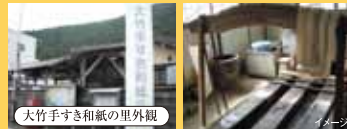
大竹手すき和紙の里外観 イメージ