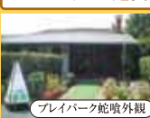
プレイパーク蛇喰外観

■募集人員/26名 ■最少催行人員/15名 ■食事/昼1回 ■添乗員/5名様以上より同行します