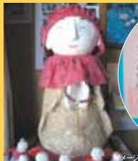
よってみんなさい屋 イメージ

竹原港からフェリーで大崎上島に渡ります。まずは昔ながらの、杉の大桶で作られる岡本醤油醸造の見学です。美味しい醤油が大切に作られています。続いては、パン工房へ。パン作り体験ができます。薬研谷温泉「ふれあいの館」では、ラジウム泉の温泉入浴と、お弁当の昼食でおくつろぎ下さい。その後は、「はなしがごちそう」のキャッチフレーズの、よってみんなさい屋へ。地元のおばあちゃん達とお茶を飲みながら、おしゃべりを楽しんで、温かい気持ちをおみやげに。